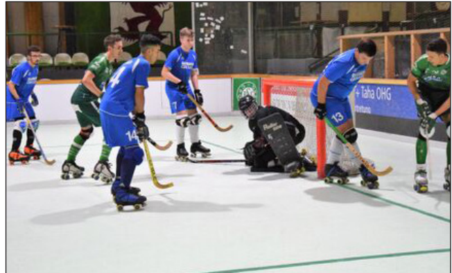
Gegen den VfL Marl-Hüls gab es einen nie gefährdeten hohen Sieg für die zweite Mannschaft des RSC