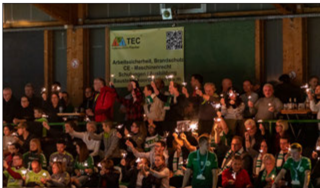
Beeindruckende Stimmung in der Alfred-Henkels-Halle