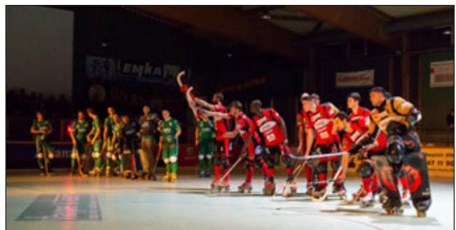
Beide Mannschaften bekamen nach dem Abpfiff viel Applaus