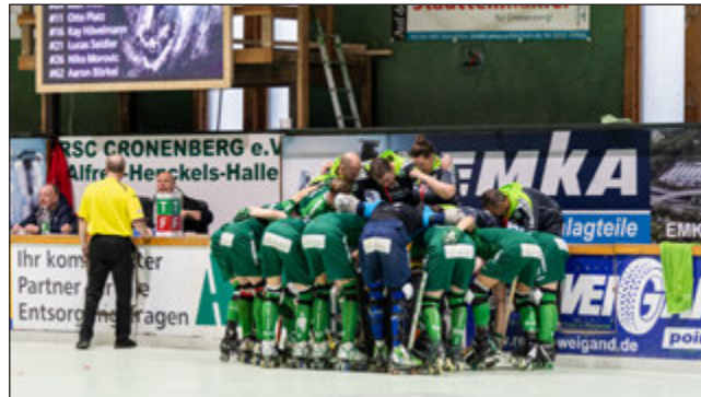
Einschwörung auf das wichtige Spiel gegen Walsum