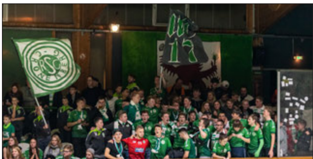
Unsere Ultras wurden nicht müde, die Löwen anzufeuern