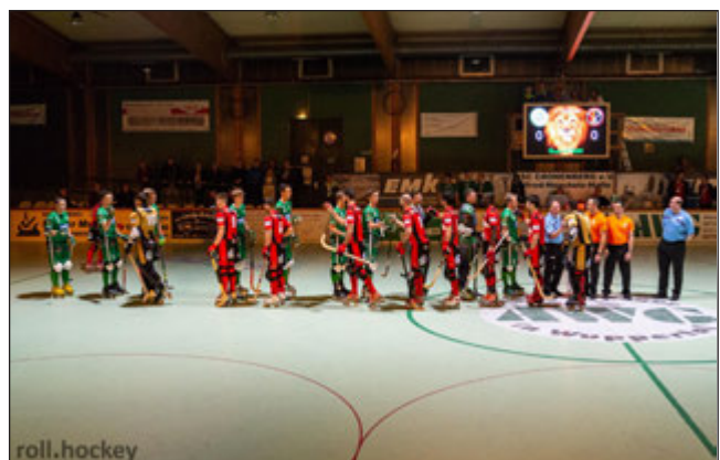
Bei der Begrüßung wurden die Europapokalteams eindrucksvoll in Szene gesetzt

auch der neue Stand der Hal-lentechnik nicht der letzte: „Man kann die Anlage erweitern“, sagt er, „zum Beispiel mit Lasern oder Showeffekten.“ Und wer weiß – vielleicht geht nach dem Traum von der Rückkehr auf die Euro-papokalbühne auch der zweite Traum irgendwann in Erfüllung. (chd)