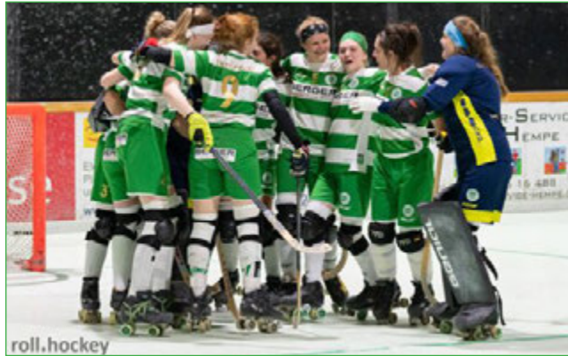
Riesensjubiläum: Mit Walsum ist das nächste Spitzenteam bezwungen