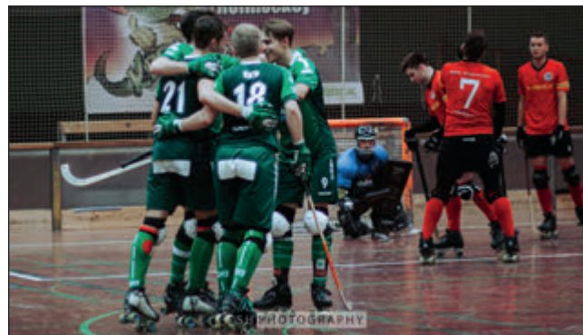
Große Freude über den erneuten Ausgleich bei unseren jungen Löwen