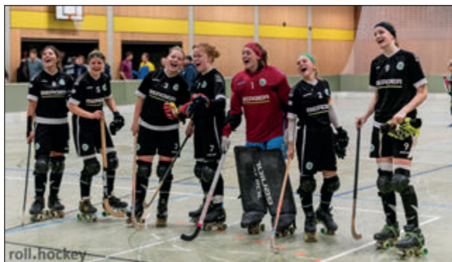
Strahlende Gesichter nach einem tollen Sieg beim Team Dörper Cats