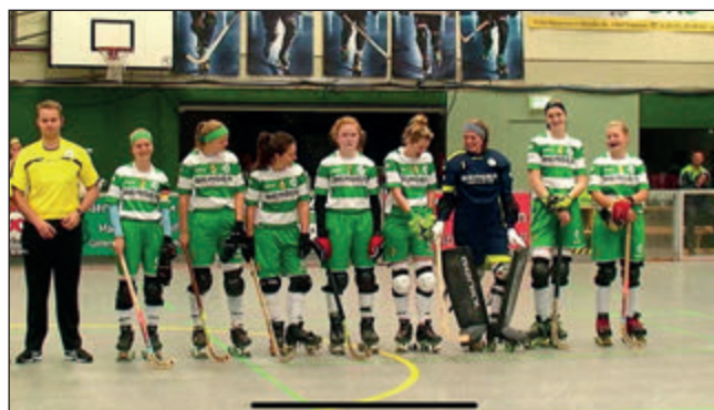
Sichtlich gut gelaunt - das Team Dörper Cats beim Supercup in Hamm-Herringen