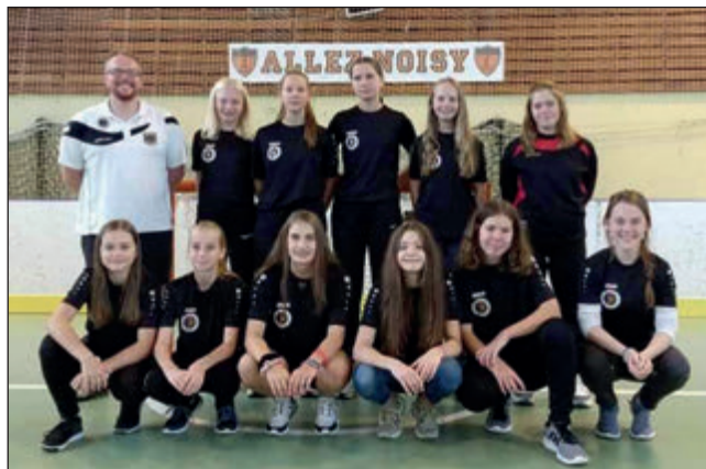
Für die deutsche Mannschaft der U15-Frauen wurden sieben Cronenbergerinnen niminiert

Deutschland – England 3:2 Deutschland – Frankreich 0:9 Deutschland – Israel 12:2 Deutschland – Andorra 6:4